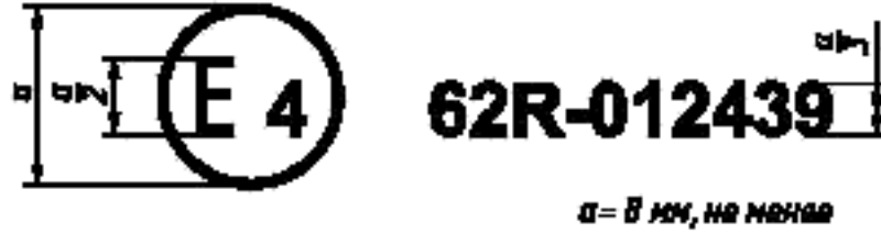
Образец А (См. 4.4 настоящих Правил)

Приведенный выше знак официального утверждения, проставленный на транспортном средстве, указывает, что этот тип транспортного средства официально утвержден в Нидерландах (E4) в соответствии с Правилами ЕЭК ООН № 62 в отношении защиты транспортного средства от угона. Номер официального утверждения указывает на то, что официальное утверждение было предоставлено в соответствии с требованиями Правил ЕЭК ООН № 62 в их первоначальной форме.