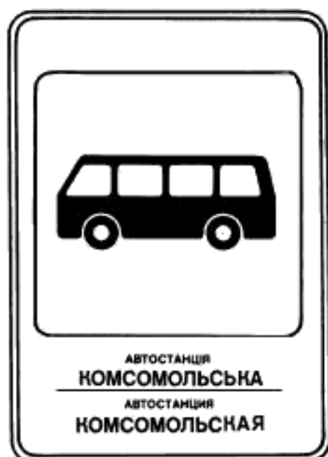
5. Указатель остановки междугородных автобусов