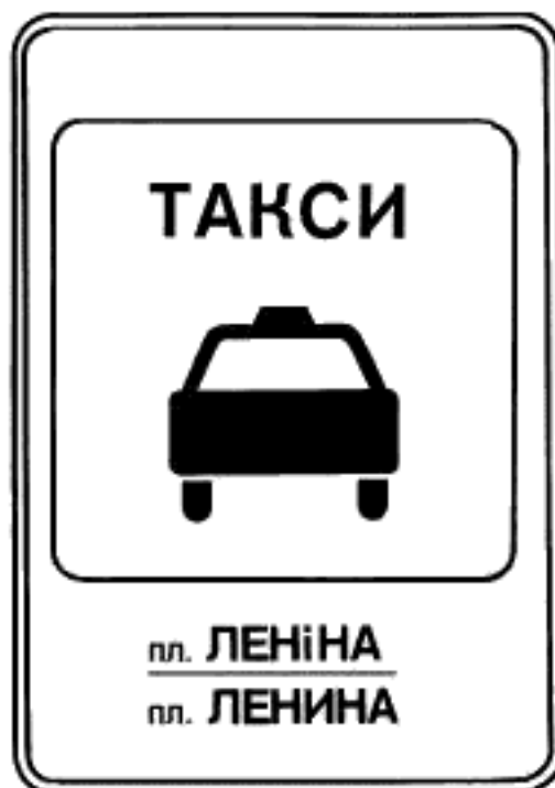
7. Указатель остановки легковых такси