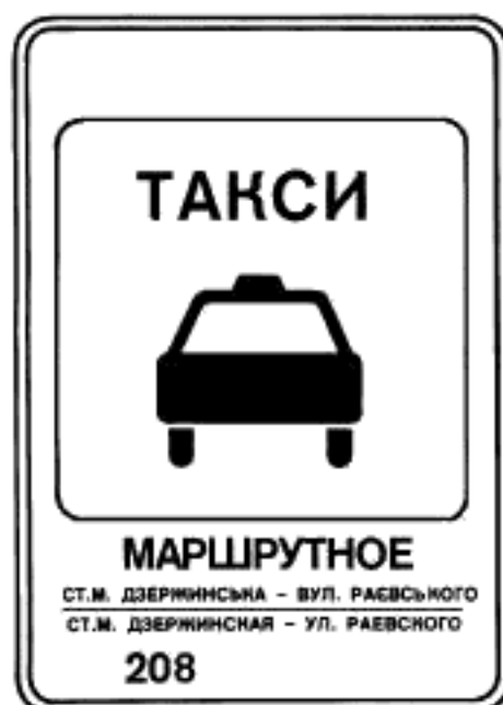
6. Указатель остановки маршрутных такси