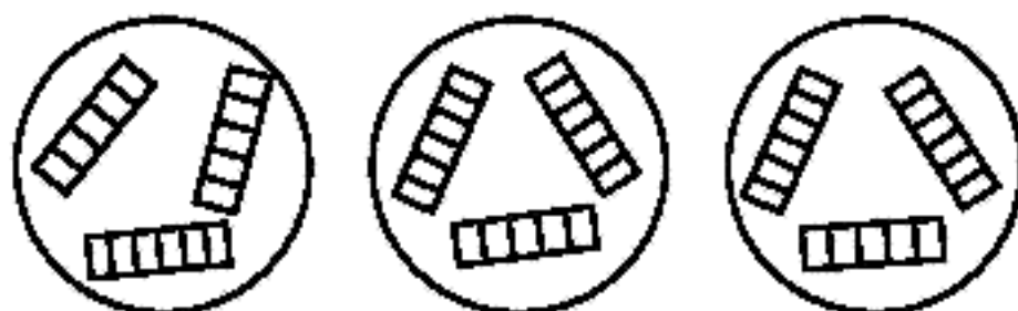
Рисунок 1 — Схема расположения подставок с образцами в эксикаторах

6.1 Для каждого варианта опыта испытывают 18 образцов: по 6 шт. на каждой из трех групп грибов (рисунок 1).