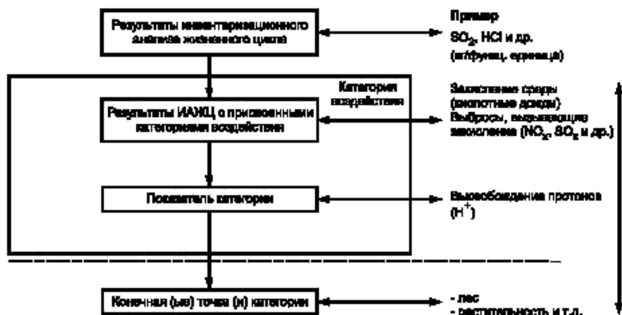
Рисунок 2 — Показатели категории

Характеристические модели отражают экологический механизм взаимодействия описанием связи между результатами ИАЖЦ, показателями категории и в ряде случаев конечной(ыми) точкой(ами) категории. Характеристическая модель используется для получения характеристических коэффициентов. Необходимые компоненты для каждой категории воздействий включают: