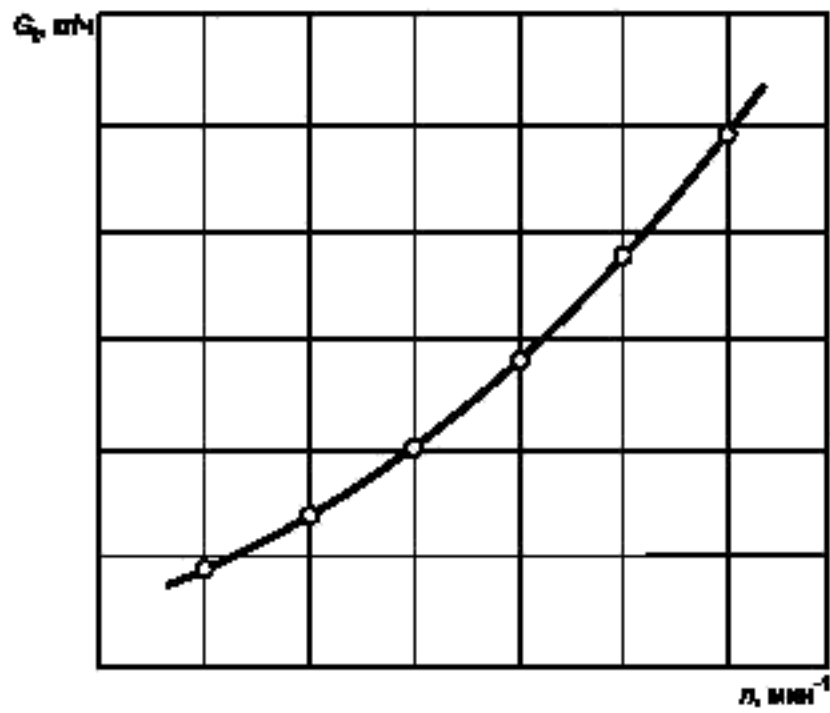
Рисунок Б.3 — Характеристика холостого хода бензоинструмента