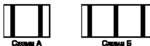
Рисунок 2 — Схема отбора проб кукурузы в початках

6.3.5 Для определения состава вороха початков кукурузы с площади длиной 0,5 м, шириной, равной ширине насыпи, по всей ее высоте отбирают пробы с подбором свободного зерна. Из автомобилей (прицепов), вагонов пробы отбирают в двух местах, в буртах — в трех местах согласно рисунку 2.