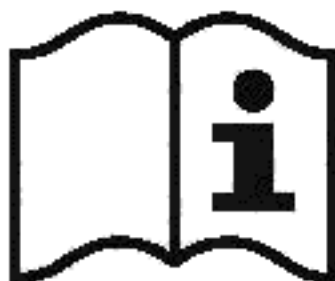
Рисунок 3 — Пиктограмма

а) пиктограмму для указания на то, что пользователь должен прочитать информацию, сообщаемую изготовителем (см. рисунок 3);