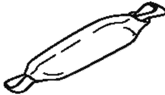
Рисунок 1 — Пример амортизатора как компонента