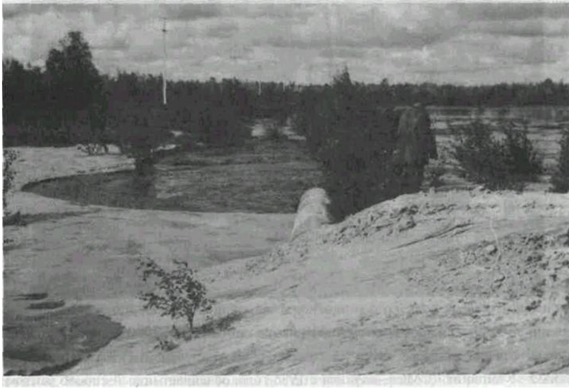
Замытый участок газопровода

Научно-практическая работа института "Оргэнерггаз" ОАО "Газпром" и Верхне-Волжского регионального научного центра Академии Транспорта, проведенная в 1997-1998 годах по обследованию и изучению физико-механических процессов происходящих на участках замытых газопроводов, показала полную надежность производства гидромеханизированных работ, хорошее состояние газопровода с точки зрения физико-механических процессов и высокую степень безопасности производства работ.